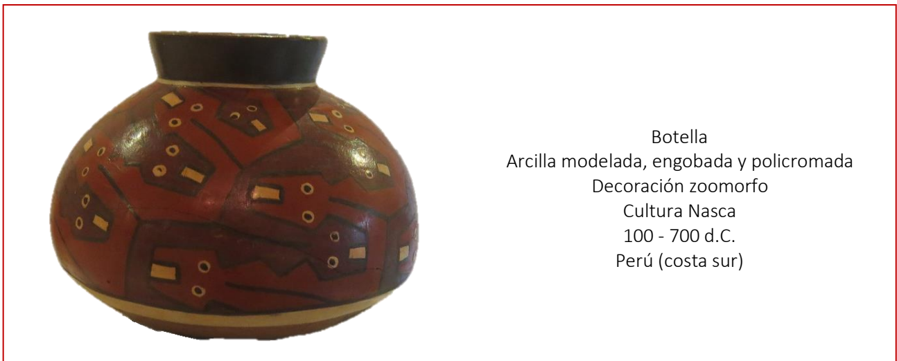
Botella Arcilla modelada, engobada y policromada Decoración zoomorfo Cultura Nasca 100 - 700 d.C. Perú (costa sur)

Imágenes que constituyen verdaderas lecciones de síntesis figurativa y cromática.