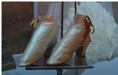
Ubicación: De la Colonia hasta el siglo XIX Independencia

Dentro de la colección del MCM se encuentran dos objetos de uso personal de Isidora Zegers: un par de zapatos y un vestido.