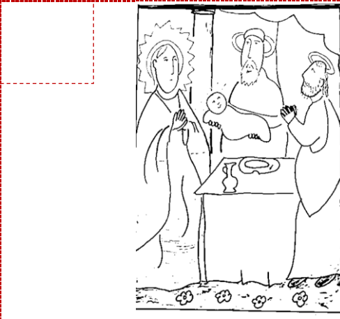
Presentación del Niño en el Templo.