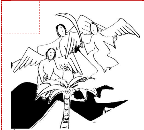
Ángeles llevando la hoja de la palmera.

Enumera el orden en que sucedieron los hechos en la historia: