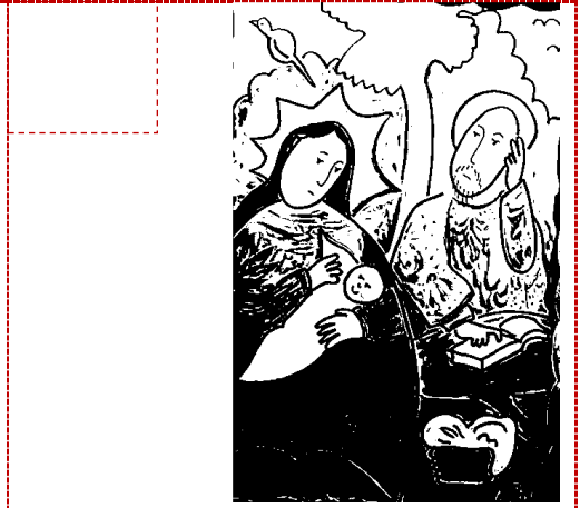
El descanso en el desierto.

Completa el crucigrama según las pistas: