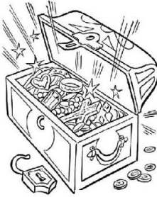
El tesoro de los Reyes Magos