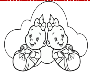
A los recién nacidos

Colorea la siguiente imagen relacionada al cuento: