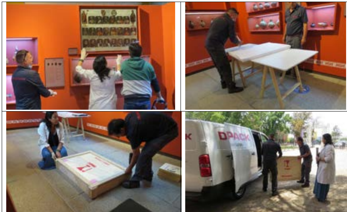
Imágenes del desmontaje, retiro y traslado de la obra hacia el MNBA por el personal del Museo y la empresa DECAPACK

El 12 de enero se realizó la inauguración de dicha Exposición en la Sala Blanco del Museo de Bellas Artes Dividida en las secciones Episterricidio, Ficción de la racialización, Erótica de la extracción y Saberes ancestrales.