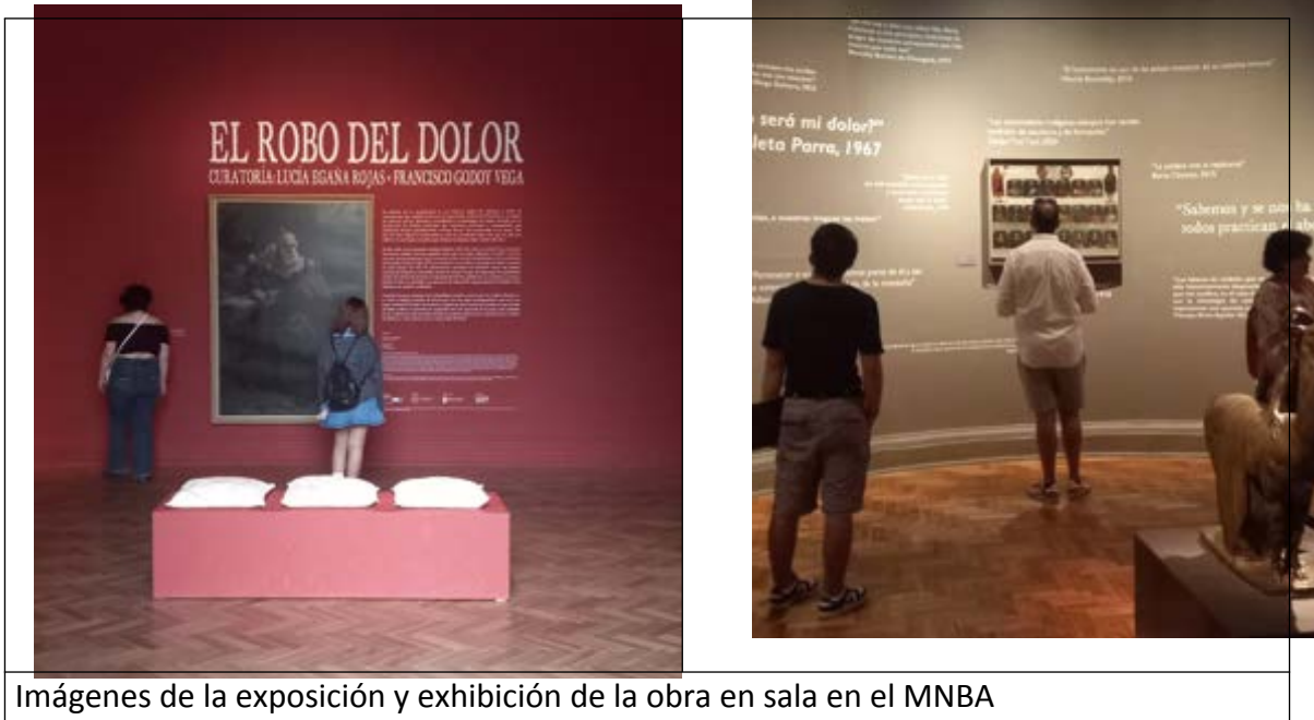
Imágenes de la exposición y exhibición de la obra en sala en el MNBA