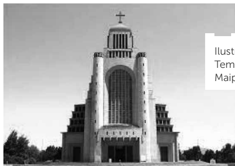
Ilustración 1: Templo Votivo de Maipú

A juicio del arquitecto Rodrigo Márquez de la Plata, quien asumió la dirección de la construcción en 1969, debido al malogrado estado de salud del arquitecto Martínez, «el edificio es un monumento conmemorativo de la batalla de Maipú por el exterior y un Santuario, en el interior» (Duque, 2021).