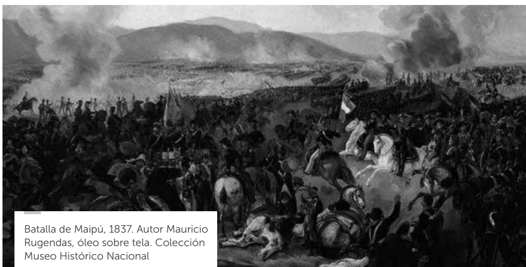
Batalla de Maipú, 1837. Autor Mauricio Rugendas, óleo sobre tela.